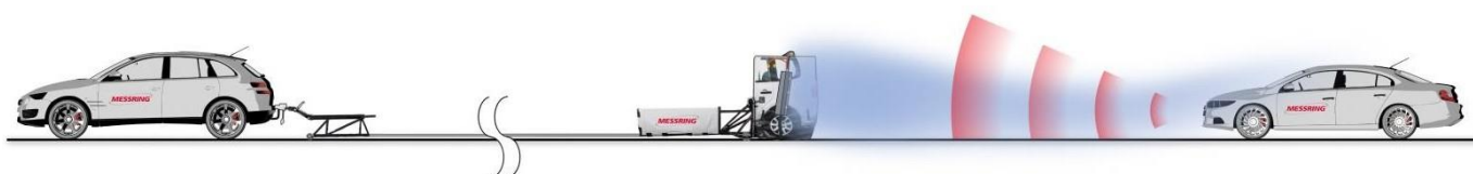
图2：测试场景：雨雾模拟装置安装在目标车上 (Euro NCAP 实验车辆)